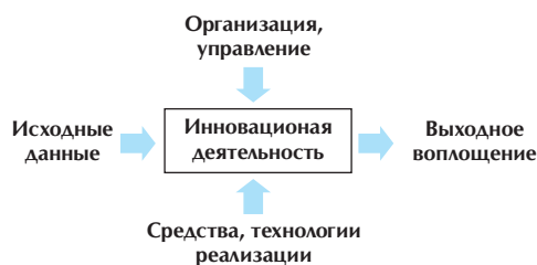
Рис. 1. Общая модель инновационной деятельности

Классическое воплощение модели посредством «чёрного ящика»