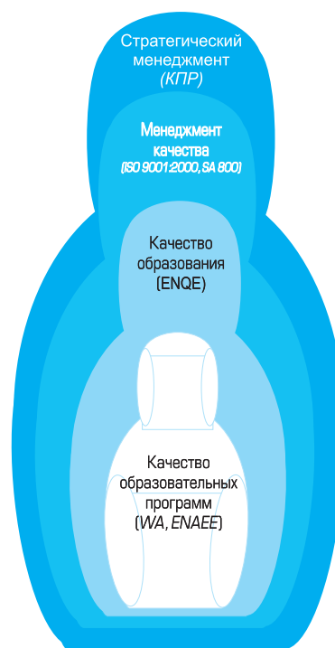
Рис.1. «Матрешка качества» вуза

содержание образования, технологии обучения, ресурсное и сервисное обеспечение и др. Таким образом, принцип отношений между стратегическим менеджментом, менеджментом качества, качеством образовательных программ и подготовки специалистов в вузе к профессиональной деятельности должен соответствовать принципу русской «матрешки» [5] (рис.1). Качество стратегического менеджмента обеспечивается разработкой и реализацией Комплексной программы развития вуза (КПР). Система менеджмента качества базируется на международных стандартах серий ISO 9001:2000 и SA 8000. Качество деятельности вуза в сфере образования обеспечивается соответствием Стандартам ENQA, и, наконец, качество образовательных программ вуза достигается с помощью механизмов общественно- профессиональной аккредитации. Важным условием успешного функционирования последнего компонента является наличие национальной системы независимой оценки образовательных