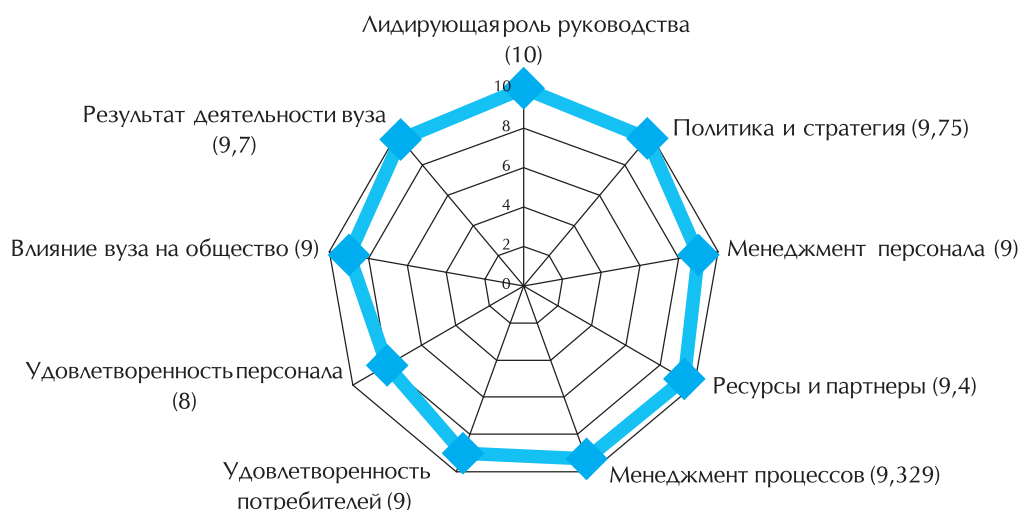
Рис. 4. Результаты самооценки ТПУ

ЭТИ, ИЯК, ММЕН, ИДО, ССЦ (консалтинговое бюро), НИИЯФ