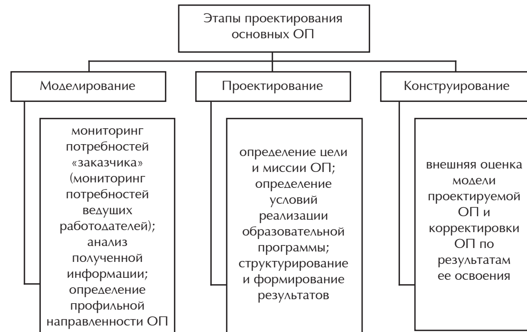
Рис. 1. Этапы проектирования образовательных программ вузовской подготовки

процесс регламентируется «Порядком организации и осуществления образовательной деятельности по образовательным программам высшего образования по программам бакалавриата, программам специалитета, программам магистратуры» (утвержден Министерством образования и науки РФ, № 301 от 05.04.2017), в котором определено: «направленность образовательной программы устанавливается вузом следующим образом: