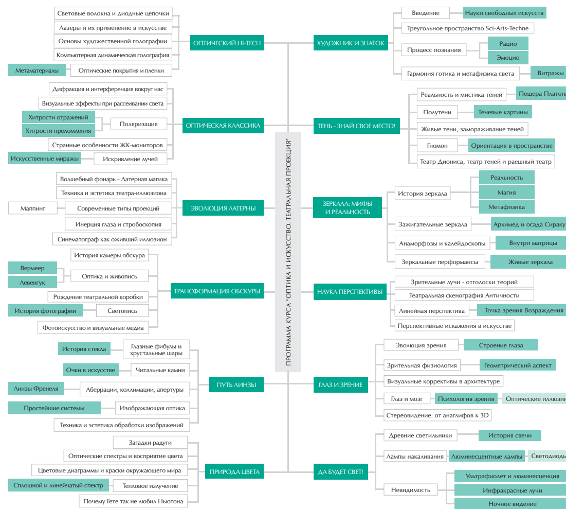
Рис. 3. Структура верхней онтологии междисциплинарного курса «Оптика и искусство. Театральная проекция»

В историко-научной составляющей обоих проектов, в частности, рассказывается о том, что теория зрительных лучей Евклида стала основой греческой сцениграфии – технологии создания театральных декораций. А так называемые архитектурные коррективы – энтазисы колонн, искривление стилобатов,